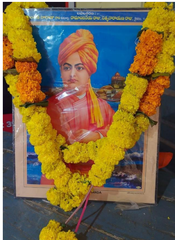
Saluting Vivekananda with a garland