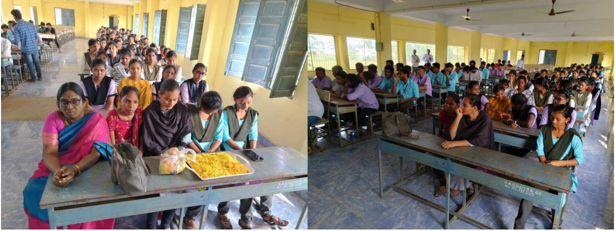
Students in the occasion