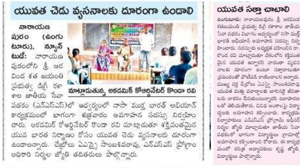
News clippings of the event