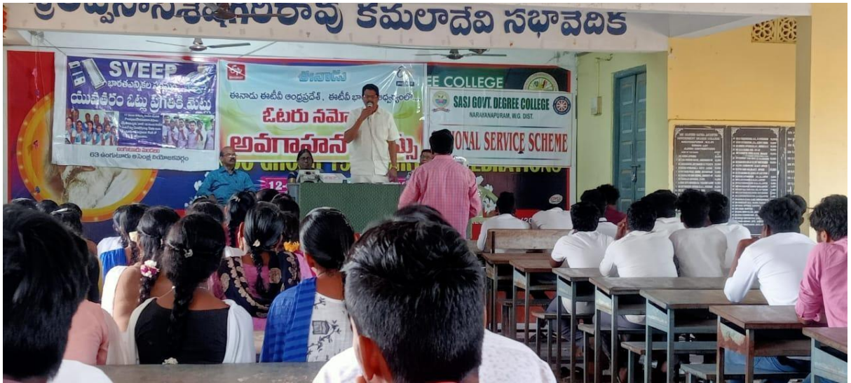
MRO addressing the students