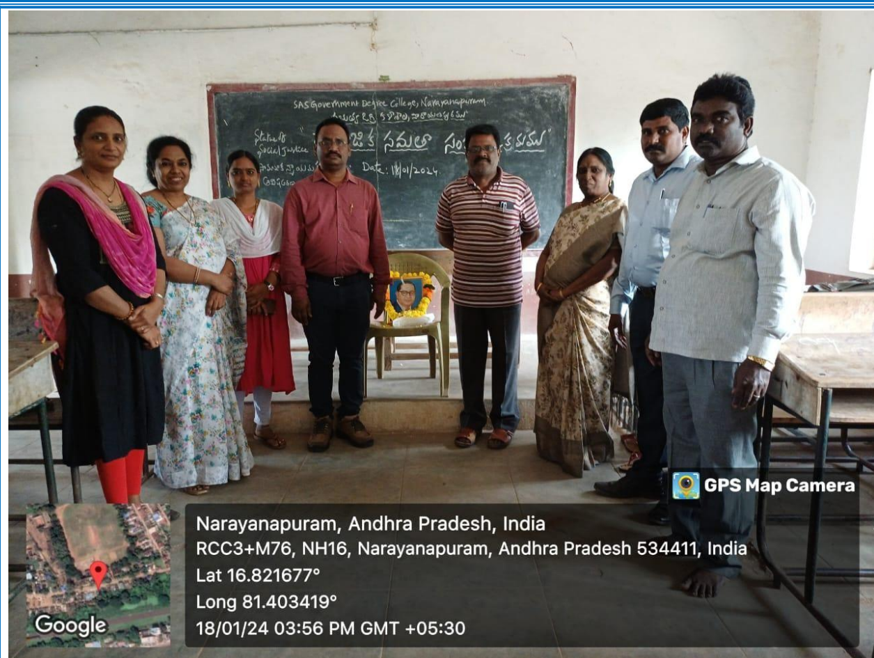
Participants of the event