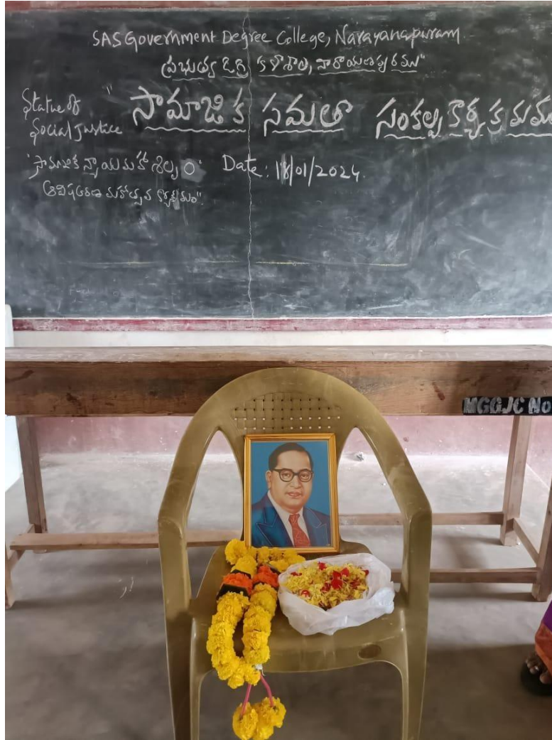
Samajik samatha sankalpa karyakram

The SAS GDC personnel observed the Samajika Samatha Sankalapa Program in conjunction with the unveiling of the Statue of Social Justice. A 125-foot statue of Dr. BR Ambedkar has been created in Vijayawada, and the government of Andhra Pradesh has issued a directive to celebrate the event at the college unit level.