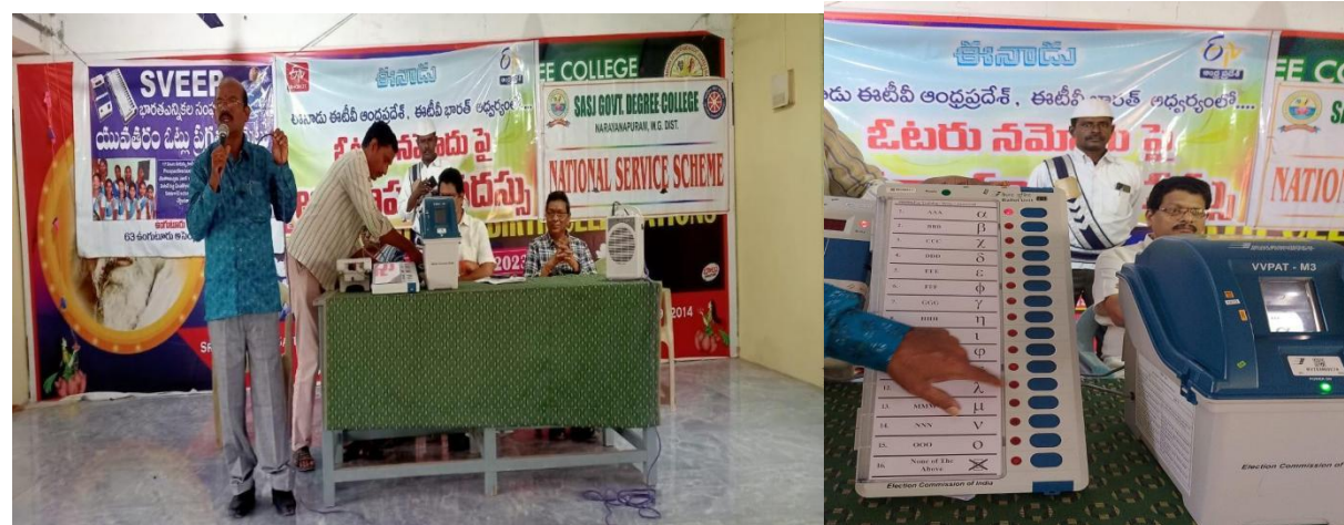
EVM operation training