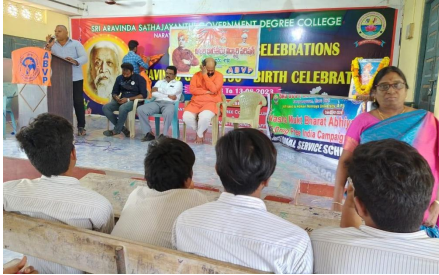
Conveying the message of Vivekananda